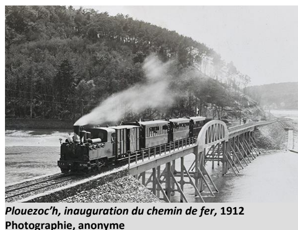
Plouezoc'h, inauguration du chemin de fer, 1912 Photographie, anonyme

Le catalogue de l'exposition peut être acheté au musée, si vous êtes intéressé, merci de le préciser lors de votre demande de réservation.