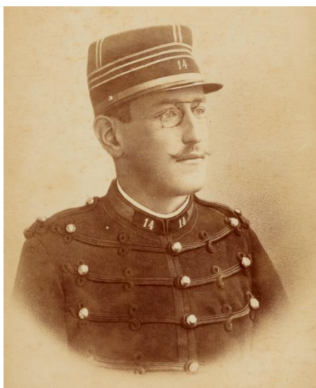
Portrait d'Alfred Dreyfus en tenue d'artilleur Aaron Gerschel, vers 1880

En lien avec : Exposition permanente « L'affaire Dreyfus » présentée au musée de Bretagne