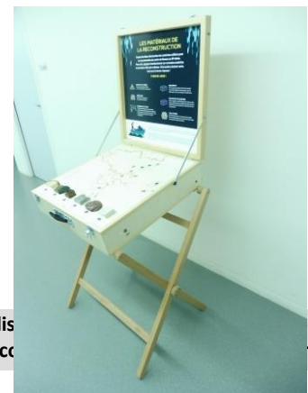
Valise jeu matériaux