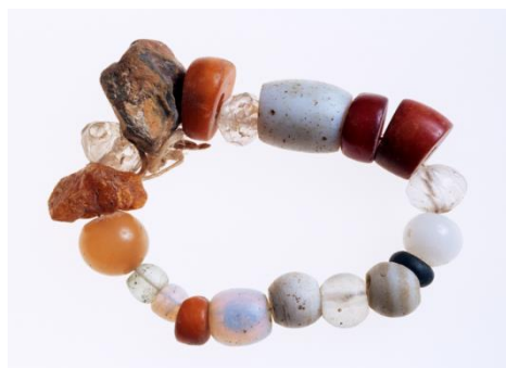
Gougad-patereu Ambre, verre et pâte de verre, Morbihan