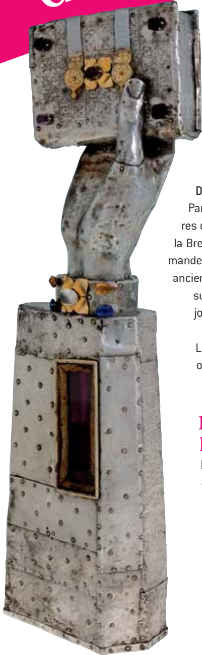
Bras reliquaire de saint Judicaël - Paimpont (I-V) - v. 1475

L e Musée de Bretagne accueille pendant six mois (24 octobre 2006 - 15 avril 2007) une grande exposition intitulée " D'Hommes et d'Argent " consacrée à l'orfèvrerie de haute Bretagne du XV ème au XVIII ème siècle. Dans la continuité de celle de 1994 sur l'orfèvrerie de basse Bretagne (présentée à l'Abbaye de Daoulas puis au Musée du Luxembourg à Paris), cette nouvelle exposition révèle les plus belles pièces d'orfèvrerie civile et religieuse réalisées par les maîtres orfèvres de Rennes, Saint-Malo, Vitré, Dinan ou Saint-Brieuc.