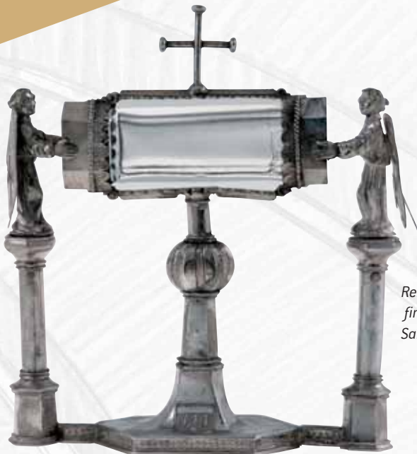
Reliquaire, fin XIVe-début XVe siècle Saint-Laurent-sur-Oust (M.)