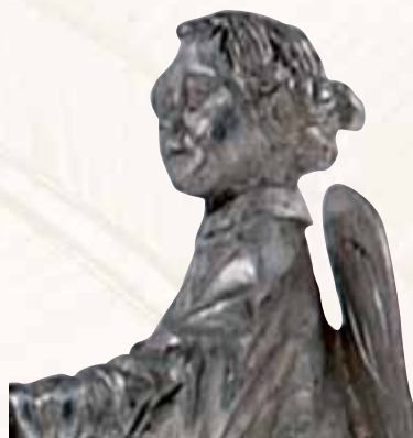
Reliquaire (détail), fin XIV e - début XV e siècle Saint-Laurent-sur-Oust (M.)