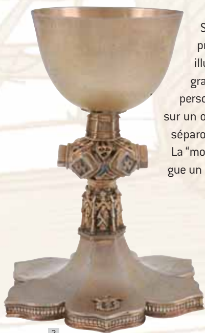
Calice Alain Maillard, Rennes, v. 1480 Locronan (F.)

La "montre" (étalage) d'une boutique d'orfèvre est reconstituée dans une troisième vitrine et met en exergue un autre aspect du métier : le commerce.