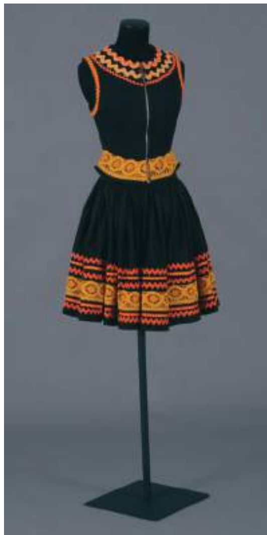
Ensemble néo-bigouden - Collection Printemps-Été 1992 - musée départemental breton de Quimper

Ces collections comptent parmi les plus riches au monde avec celles du musée Galliera à Paris, du musée des Tissus de Lyon, du Victoria and Albert Museum de Londres et du Metropolitan Museum de New York. On y trouve des pièces exceptionnelles de textile depuis le XIV e siècle et de mode depuis le XVII e siècle, ainsi que des créations de couturiers du XX e siècle, tels que Jeanne Lanvin, Chanel, Pierre Balmain, Christian Dior, Paco Rabanne, Yves Saint-Laurent, ou encore Christian Lacroix. Val Piriou entre à son tour au musée en 1997, par le biais d'une donation de Marie-Paule Piriou.