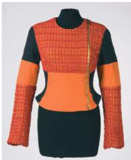
Gilet néo-bigouden - Collection Printemps-Été 1992 - musée de Bretagne