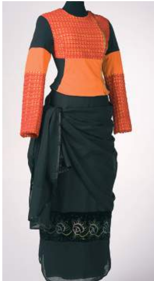
Gilet néo-bigouden - Collection Printemps-Été 1992 Jupe aile de papillon - Collection Automne-Hiver 1994