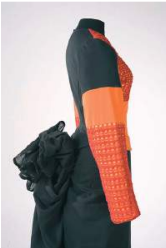
Gilet néo-bigouden - Collection Printemps-Été 1992 Jupe aile de papillon - Collection Automne-Hiver 1994 - profil