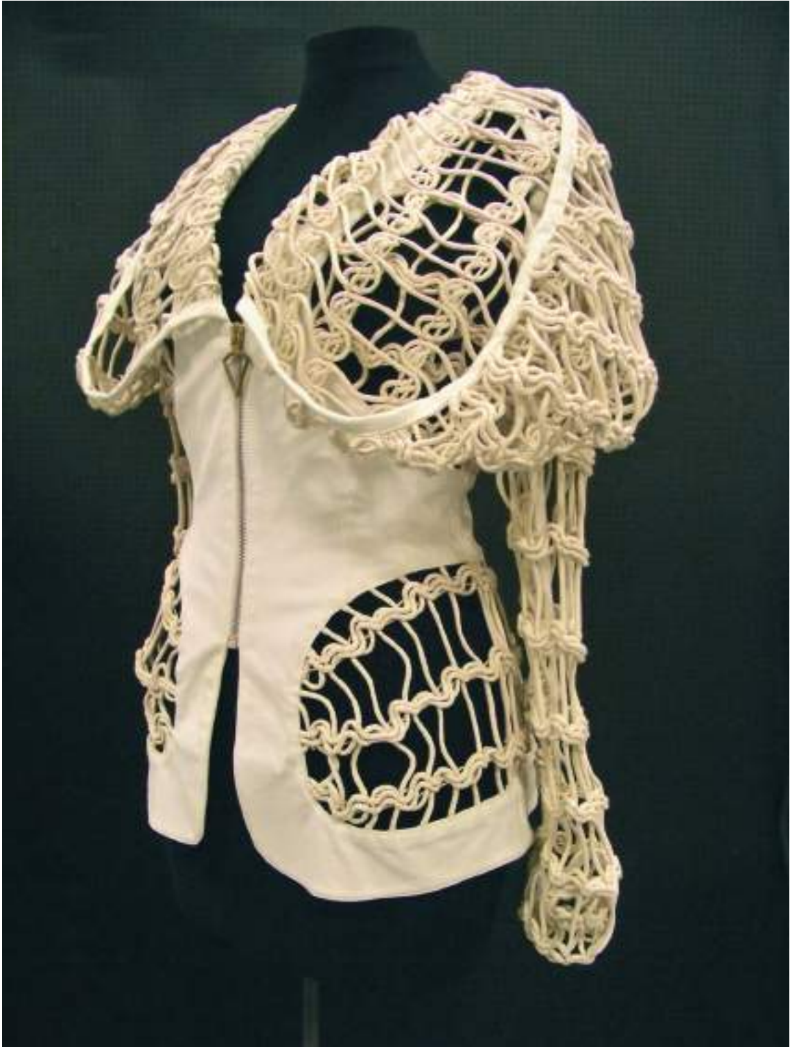
Kabig en dentelle de corde