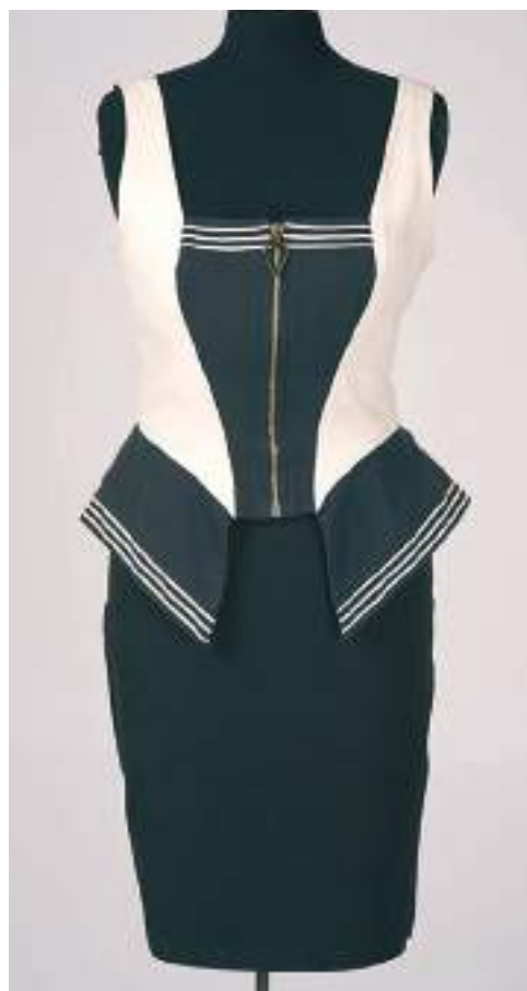
Haut marin à basques - Collection Printemps-Été 1992