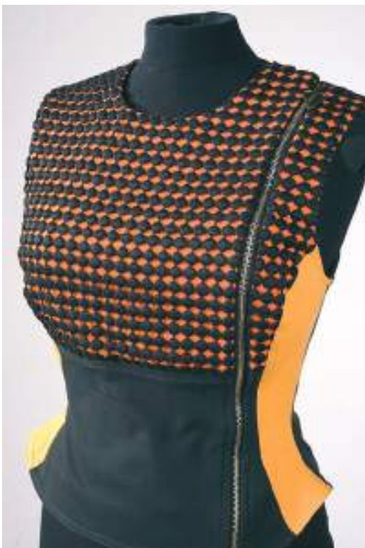
Gilet néo-bigouden sans manches - Collection Printemps-Été 1992 - musée de Bretagne

Cette « exposition dans l'exposition » pourra être parcourue de manière autonome et également en complément de la visite du parcours permanent.