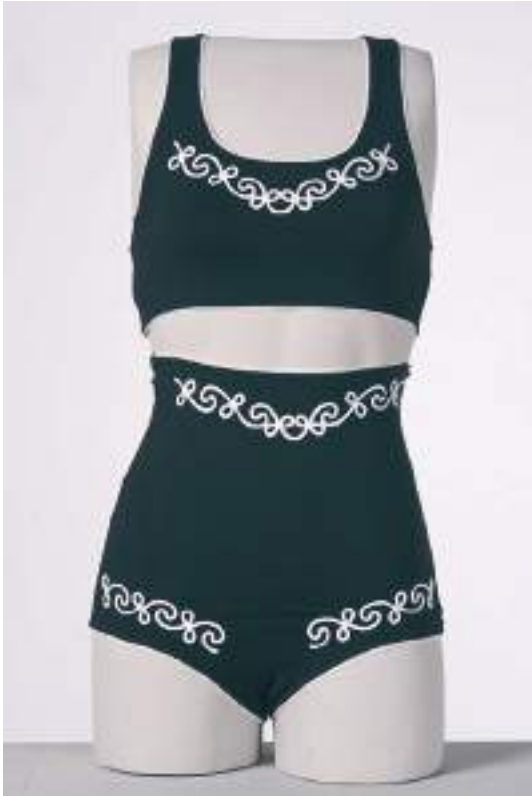
Brassière et culotte noires à entrelacs - Collection 1987