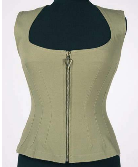
Gilet cintré vert - Collection Printemps-Été 1991