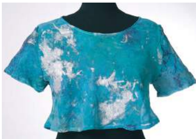
Haut turquoise rehaussé d'argent - Collection Printemps-Été 1995