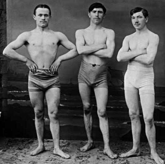
Fonds Anne Catherine, Redon, 1914, coll. musée de Bretagne